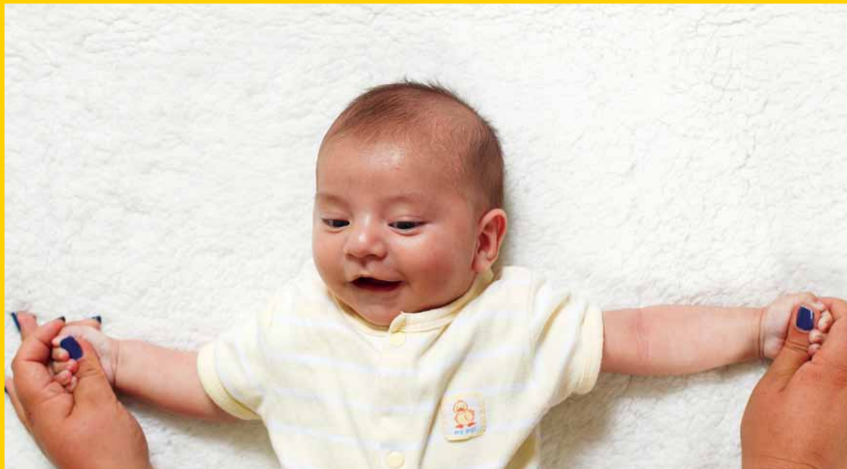
ACTIVIDADES PARA BRAZOS Y PIERNAS