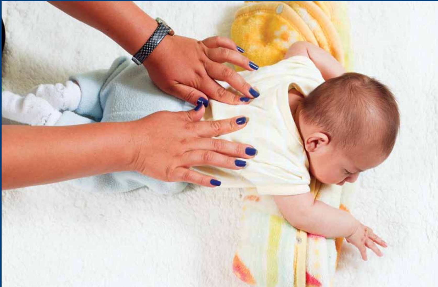
ACTIVIDADES PARA LEVANTAR Y CONTROLAR LA CABEZA