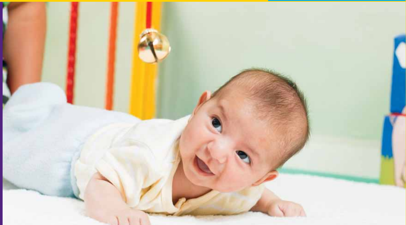
VISIÓN Y AUDICIÓN